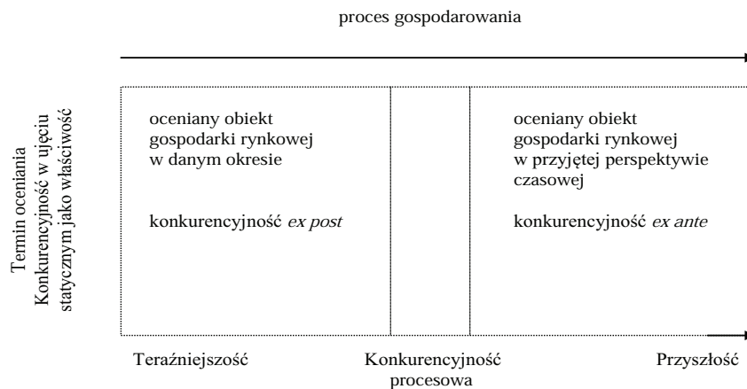
Rys. 1. Perspektywy analizy konkurencyjności

menty konkurowania 2 . Ta powinność wskazuje, że konkurencyjność aktywnego uczestnika życia gospodarczego związana jest z terminem – zdolność – rozumianego jako możliwość do czynnej rywalizacji ocenianego obiektu z innymi uczestnikami gospodarki rynkowej. Przy uwzględnieniu, że gospodarowanie i uczestniczenie w nim jest procesem, można stwierdzić, że konkurencyjność staje się także kategorią dynamiczną i procesową. W konkurencyjności w podejściu procesowym aktorzy gospodarowania budują zdolności do sprostania konkurentom i wygrywania rywalizacji w analizowanych sferach działania, w ocenianym terminie oraz w przyszłości (rys.1).